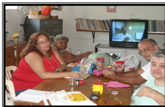
Momento de terapia dos idosos, aula de confecção de bijuterias.