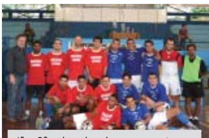
1º e 2º colocados do campeonato