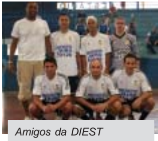
Amigos da DIEST