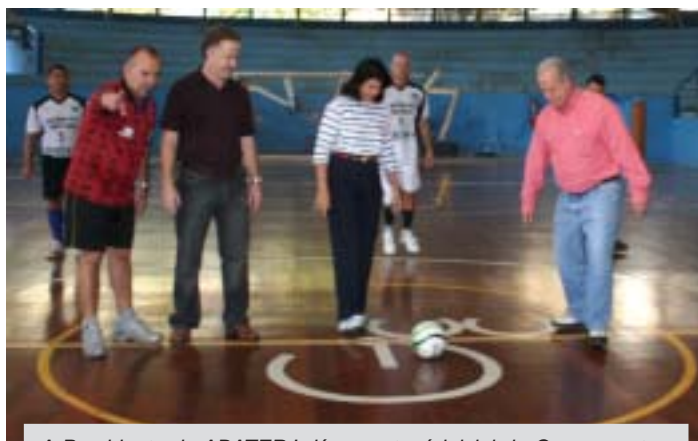
A Presidente da ABATERJ dá o pontapé inicial do Campeonato