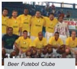
Beer Futebol Clube