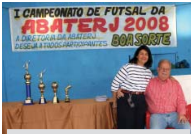
Casal Murta Ribeiro, a Presid. da ABATERJ e o Presid. do TJRJ