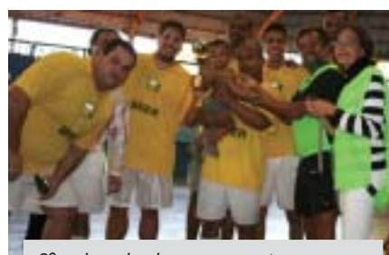
3º colocado do campeonato