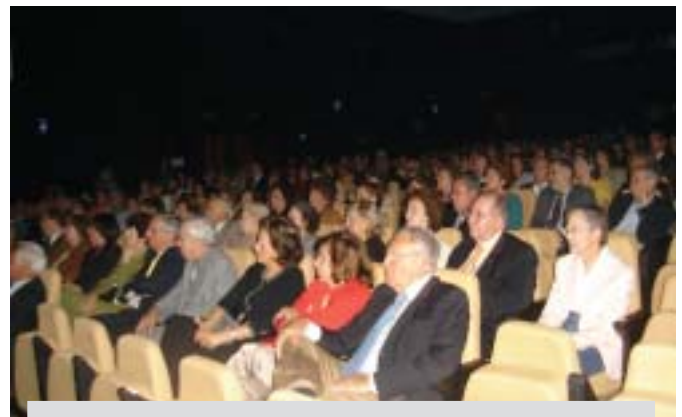
Público presente no recital em comemoração ao 9º aniversário da ABATERJ